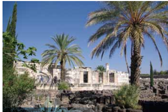
カペナウム (シナゴーク跡)