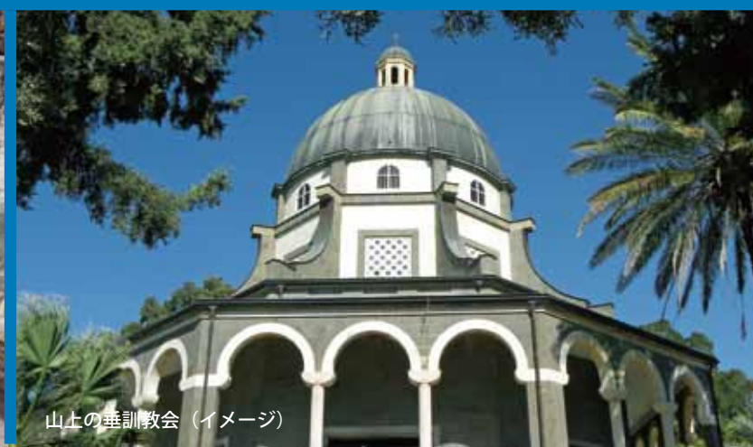
山上の垂訓教会（イメージ）