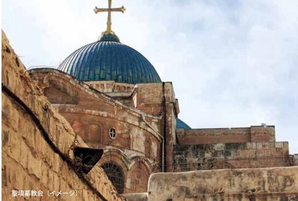
聖墳墓教会（イメージ）

■旅行条件要旨基準日：この旅行条件要旨の基準日は2017年10月11日です。また、旅行代金は2017年10月11日現在有効なものとして公示されている航空運賃・適用規則を基準として算出しています。