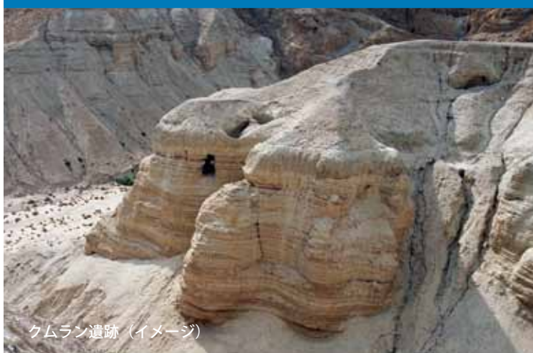
クムラン遺跡（イメージ）

＜個人情報の取扱について＞ 当社は「個人情報の保護に関する法律」並びに「当社個人情報保護方針」に基づき、お客様の個人情報を次のようにお取り扱いし、保護に努めております。1) ご旅行の申し込み等にあたり当社にご提供いただいた個人情報の一部を個人データとして保有しています。2) 当社は旅行申し込み書に記載された個人情報について、お客様との連絡の為に利用させていただく他、申し込みいただいた旅行において運送・宿泊機関等の提供する旅行サービスの手配及びそれらのサービスの受領の為に手続きに必要な範囲で利用させていただきます。