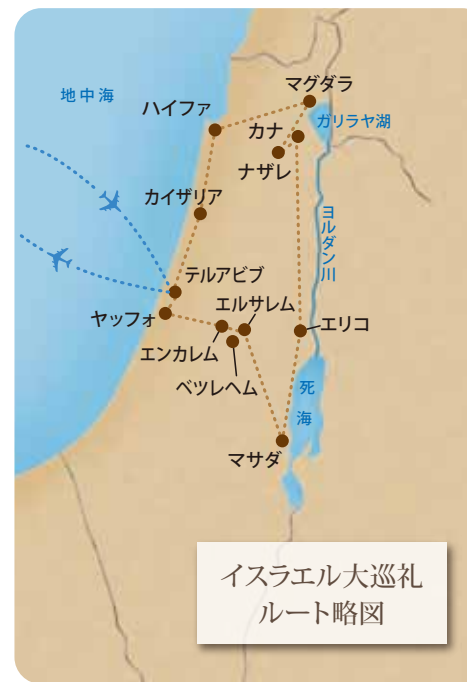
イスラエル大巡礼 ルート略図